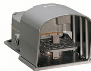
Wyłączniki jednopedałowe. Z dźwignią bezpieczeństwa - z osłoną KR210